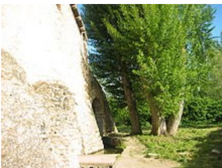
Località Fonti, battistero di San Giovanni

Il primo riconoscimento del vallo di Diano è nel giugno 1997, con l'inserimento nella prestigiosa rete delle Riserve della biosfera del Mab-Unesco [2] (dove Mab sta per "Man and biosphere"): su tutto il pianeta (in oltre 80 stati) si contano circa 350 di queste particolari aree protette, che servono per tutelare le biodiversità e promuovere lo sviluppo compatibile con la natura e la cultura. Così il Parco del Vallo di Diano oggi, oltre ai suoi preziosi habitat naturali, può a maggior diritto salvaguardare quegli scenari consacrati dalla storia dell'uomo e permeati dalle sue tradizioni: borghi